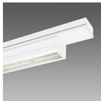
6603 Techno System - ellittica 30°x80° - CRI 90