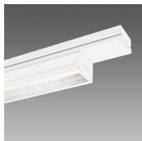
6613 Techno System HE - bi-asimmetrico 25° - CRI 80