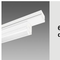
6616 Techno System HE - diffusore semisferico diffondente - CRI 80