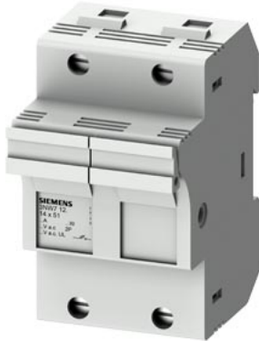
SENTRON, portafusibili per cartucce cilindriche, 14x51 mm, a 2 poli, In: 50 A, Un AC: 690 V