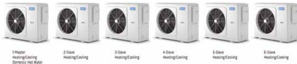
1-Master Heating/Cooling Domestic Hot Water

Gestione in cascata fino a 6 unità. Potenza impianto fino a 96 kW.