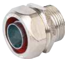
art. 6014 MASCHIO FISSO FIXED MALE