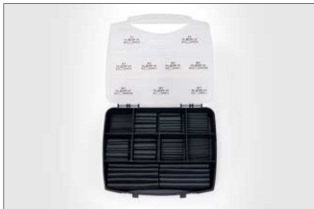
ShrinkKit 321 Basic - 220 spezzoni assortiti di termorestringente 3:1.