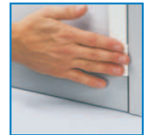
Montaggio a scatto