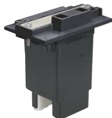
Gruppo bobina completo