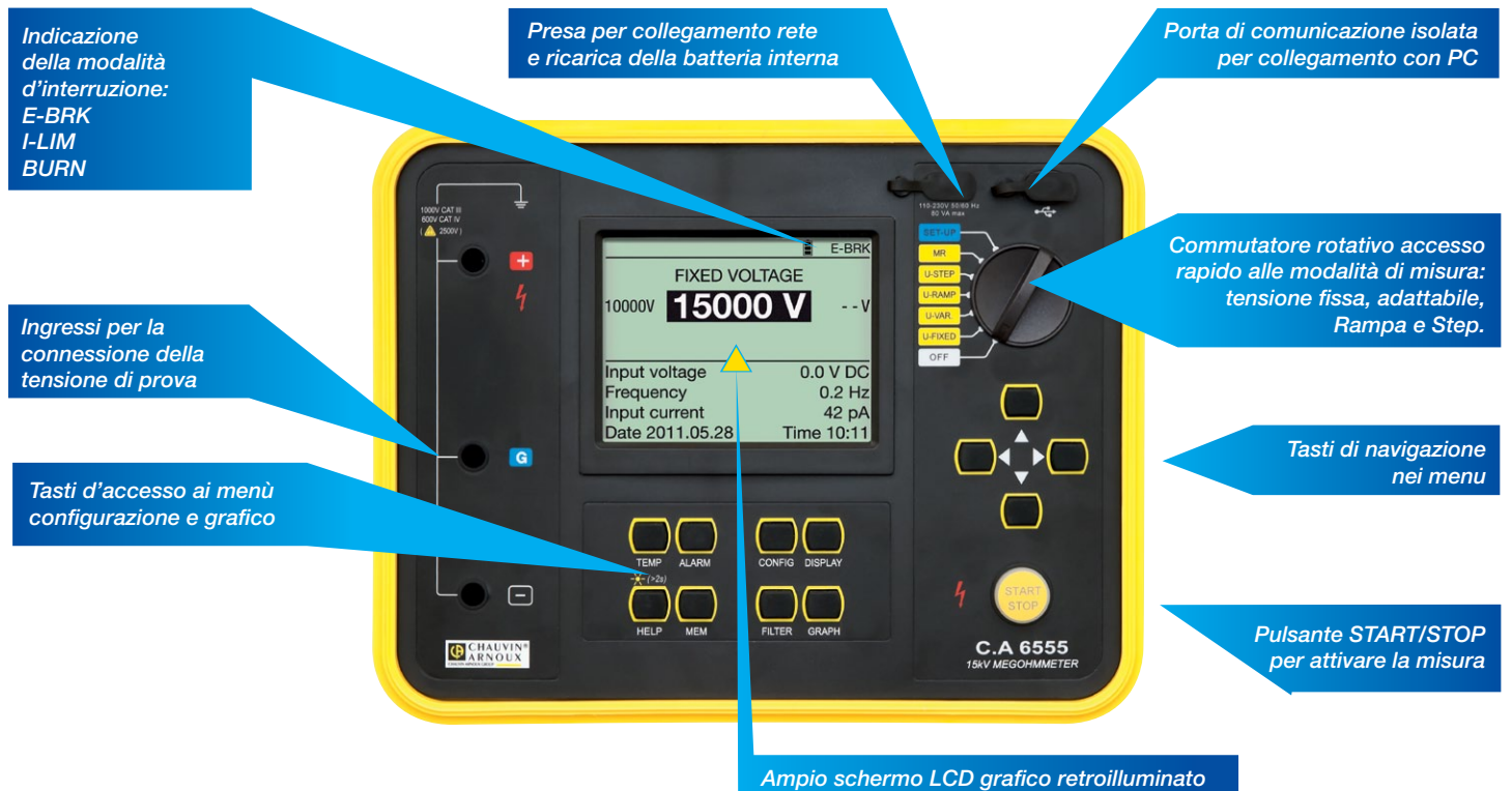
Ampio schermo LCD grafico retroilluminato

Il display C.A. 6550 e C.A. 6555 offre una visualizzazione rapida ed efficace di come svolgere i test mediante grafici dell'evoluzione del test in corso. Un'ottima capacità di memoria, permette un'analisi completa (dopo trasferimento dei dati di misura su PC mediante il software DATAVIEW), delle campagne di prova effettuate in campo.