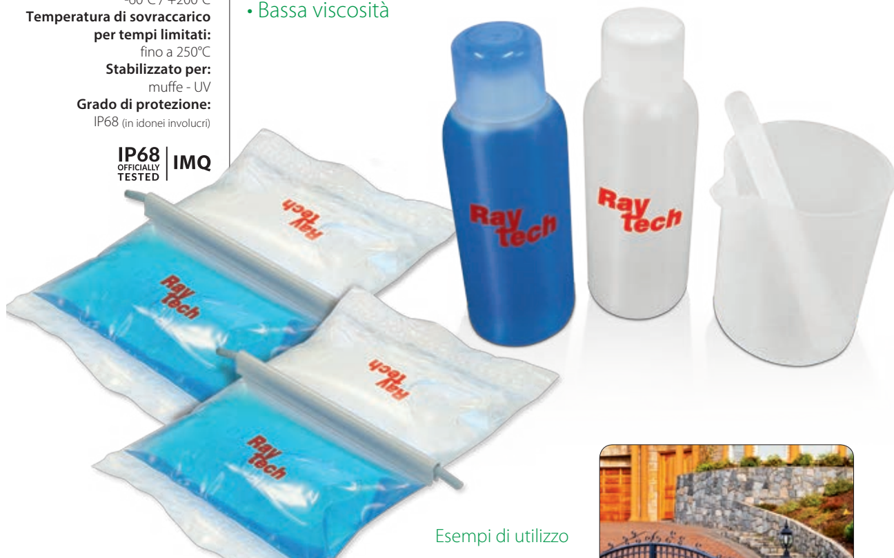
Esempi di utilizzo