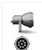
S.1066 MINIFOCUS LED RGB 20W 230V