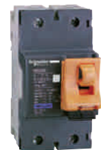
Blocco a lucchetto