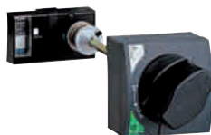
Manovra rotativa rinviata

Nota: gli interruttori NG125 3P/4P integrano il dispositivo di blocco a lucchetto in posizione di aperto (O) sul fronte.