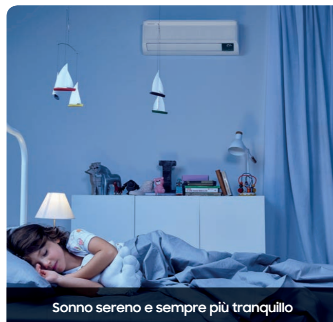
Sonno sereno e sempre più tranquillo

In aggiunta il Sensore di Movimento (MDS) attiva o disattiva il climatizzatore in base alla presenza o meno di persone nell'ambiente riducendo eventuali sprechi.