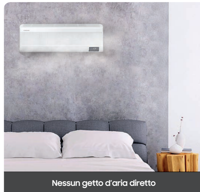
Nessun getto d'aria diretto

* Definizione identificata dall'ente terzo Ashrae Per maggiori informazioni, consultare il sito https://www.ashrae.org/about .