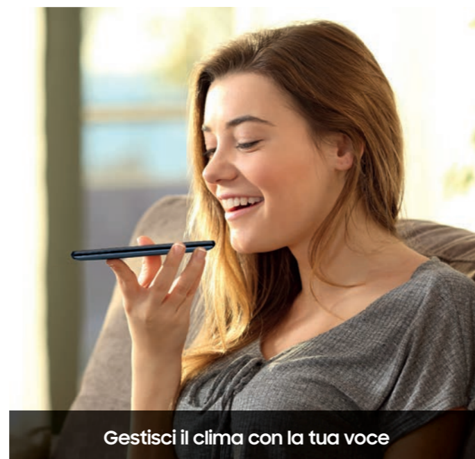
Gestisci il clima con la tua voce

La funzione Artificial Intelligence analizza e apprende le abitudini dell'utente, replicando automaticamente le funzionalità più adatte ad ogni situazione d'utilizzo.