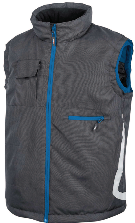
code PE115GB col. GREY BLUE