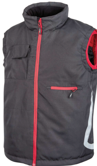
code PE115GR col. GREY RED