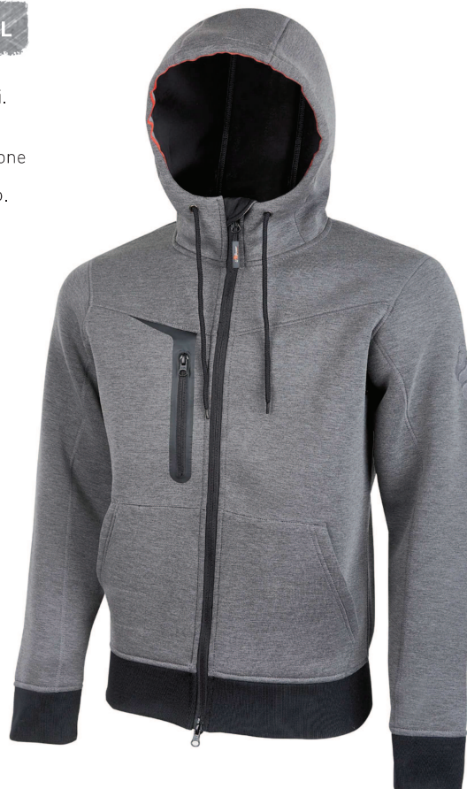
code PE119GM col. GREY METEORITE