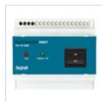
2730 INIBIT 973 COMANDO R.MODE