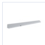
19045 STAFFA A PARETE X BANDIERA F65