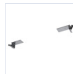
19049 STAFFA CONTROSOFFITTO F65 EX