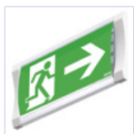
19044 ADES SX DX BS F65