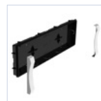
19048 SCAT INCASSO + CORNICE F65 EX