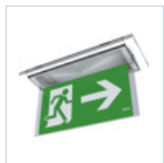
19042 SCHERMO BANDIERA DX/SX F65