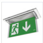
19043 SCHERMO BANDIERA BASSO F65