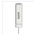
15048 MODULO RM PLUG