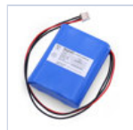
415444101 LI-FEPO4 9.6V 1.5AH 18650 3P