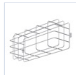
3912 GRIGLIA EM 440X215X99